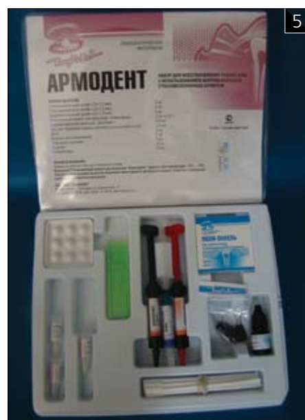
Рис. 5 Набор "Армодент"

Фирма "ВладМиВа" выпускает штифты и балки "Армодент" в комплекте (рис. 5), включающем композиционный цемент двойного отверждения "Компофикс", однокомпонентный светоотверждаемый адгезив "ДентЛайт", гель для протравливания эмали и дентина и другие аксессуары, позволяющие врачу-стоматологу выстроить единую технологию реставрации коронковой части зуба.