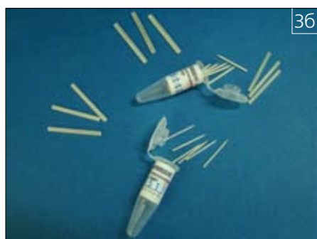
Рис. 3 Балки и штифты "Армодент"

Методика применения штифтов "Армодент" проста (рис. 4). После эндодонтического лечения и надёжного пломбирования верхушечной части корня подготавливают ложе штифта соответствующей развёрткой, а затем калибровочной фрезой. Подготовленный расширенный участок корневого канала должен составлять не менее половины длины корня (рис. 4а). Подгонку стекловолоконного штифта или балки делают эмпирически с помощью конусовидных алмазных боров. Перед введением штифта изолированный зуб вместе с каналом протравливают гелем на основе ортофосфорной кислоты, тщательно промывают и высушивают (рис. 4б). Штифт перед фиксацией обезжиривают и обрабатывают адгезивом. Фиксацию стекловолоконных штифтов и балок проводят с помощью композиционного цемента двойного отверждения "Компофикс" с предварительной обработкой тканей зуба адгезивом "ДентЛайт" (рис. 4в-е).