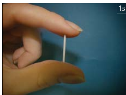
■Рис. 1. Стекловолоконные штифты “Армодент”

Штифты “Армодент” предназначены для пассивной фиксации в полости корня, они не оказывают давления на стенки корня зу-